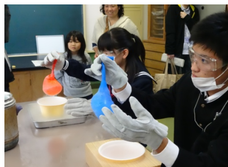
WS5:「バナナで釘を打とう!(感じよう-196°Cの世界)」